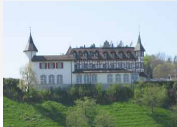
Dancing Klein Rigi